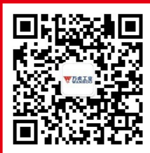
万虎工业微信公众号